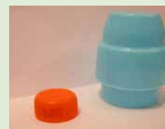
Tappi da conferire: quelli di bibite e detersivi.