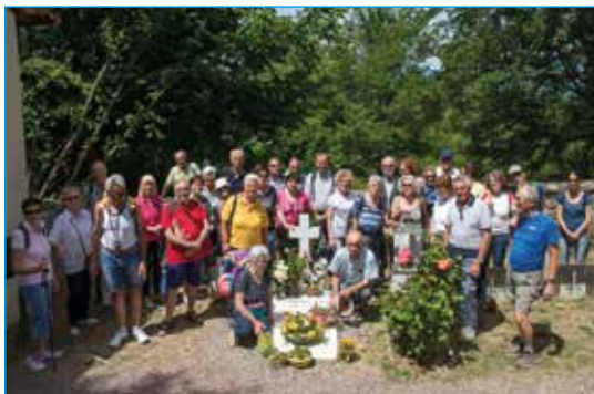
Sull'umile tomba di Don Milani...

enormi, e il nostro entusiasmo. A buona parte di noi è toccata la medesima sorte del buon don Lorenzo. Considerati dei traditori, dei pericolosi sovversivi, allontanati, malvisti. Per tutta la sua vita sacerdotale, prima a San Donato Calenzano e poi a Barbiana, fu costantemente tenuto in esilio, proibito pubblicare i suoi scritti, diffidato a ricevere o accogliere confratelli sacerdoti, a loro volta diffidati di frequentarlo. Nonostante queste severe limitazioni riuscì a far vivere una scuola validissima, tuttora oggetto di studi, a vivificare una parrocchia abbandonata inizialmente frequentata solo da un paio di vecchiette. Senza mai uscire dal suo