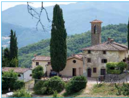
Una veduta di Barbiana